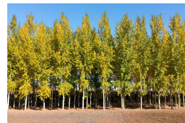
Plantación de chopos en la Cuenca del Duero