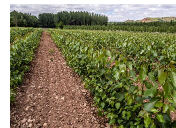
Vivero de chopos de Garnica en Baños de Río Tobía