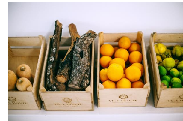
Los orígenes del contrachapado: cajas de fruta